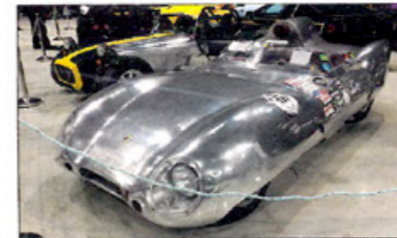
▲ Le Club Lotus France était très largement représenté pour fêter dignement les 70 ans de la marque. Cette Lotus XI a obtenu tous les suffrages.