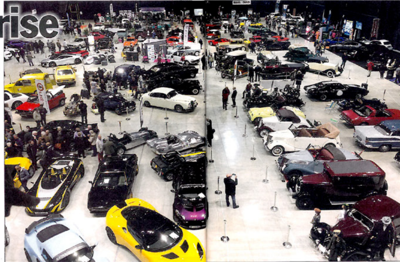
« L'espace Carat du Grand Angoulême est un véritable écrin pour une exposition de voitures de collection de sport et de prestige qui offre un tour d'horizon de grande qualité. »

D ouze ans déjà que l'espace Carat, le parc des expositions et des congrès du Grand Angoulême, est la plus importante infrastructure de réception de Charente. Ce magnifique outil de 6 000 m 2 couverts et 17 000 m 2 de surface utile en extérieur, est particulièrement bien adapté à un salon comme celui qu'organisent Patrick Couton et son équipe. Éclairage subtil, acoustique