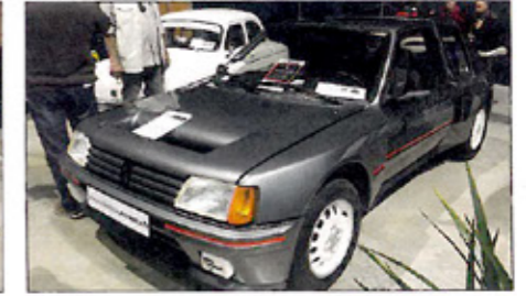
▲ Quelques professionnels, dont Classic auto restor, présentent de magnifiques exemplaires de youngtimers, comme cette Peugeot 205 Turbo 16 dans un état remarquable.