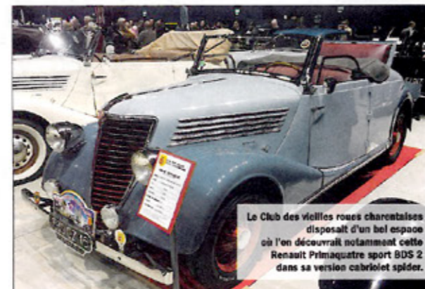
Le Club des vieilles roues charentaises disposait d'un bel espace où l'on découvrait notamment cette Renault Primaquatre sport BDS 2 dans sa version cabriolet spider.

« Nous sommes heureux de voir que le salon progresse chaque année. La fréquentation est passée de 10 000 à plus de 16 000 visiteurs cette année. Nous tenons beaucoup au principe de gratuité, ce qui explique sans doute aussi ces chiffres de fréquentation. Nous faisons la part belle aux clubs régionaux et faisons financer le salon par les annonceurs et les professionnels. La recette fonctionne, ce qui nous ravit car nous sommes avant tout de vrais passionnés d'automobile, sous toutes ses formes. »