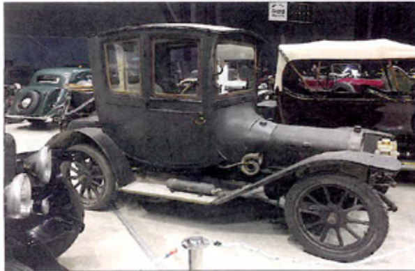
Cette Delage R3 de 1910 en version coupé docteur est un petit bijou. Elle a pourtant bien failli finir découpée en roadster !

L'espace Carat à Angoulême accueillait la 4 e édition d'un salon où toutes les passions de l'automobile se rejoignent. Avec 16 000 visiteurs sur deux jours, cette initiative ne fait que progresser.