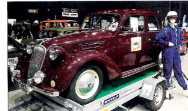
« Fort d'un large panel d'amateurs, le club Garat auto passion présentait cette adorable Simca 8 au milieu d'une quinzaine de voitures. »

« Nous mettons beaucoup d'énergie à proposer des voitures très différentes à chaque édition. Nous jouons le jeu car ce salon est une belle initiative. Nous exposons quatorze voitures et mettons à disposition sept Citroën pour l'exposition spécifique. » CONTACT : tél. 05 45 60 66 41