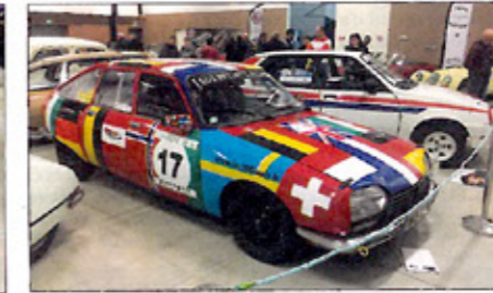
▲ Cette GS de 1973 participait au Trophée André Fabre, où elle a obtenu trois victoires et huit podiums. Elle était présentée par un membre de Garat auto passion.