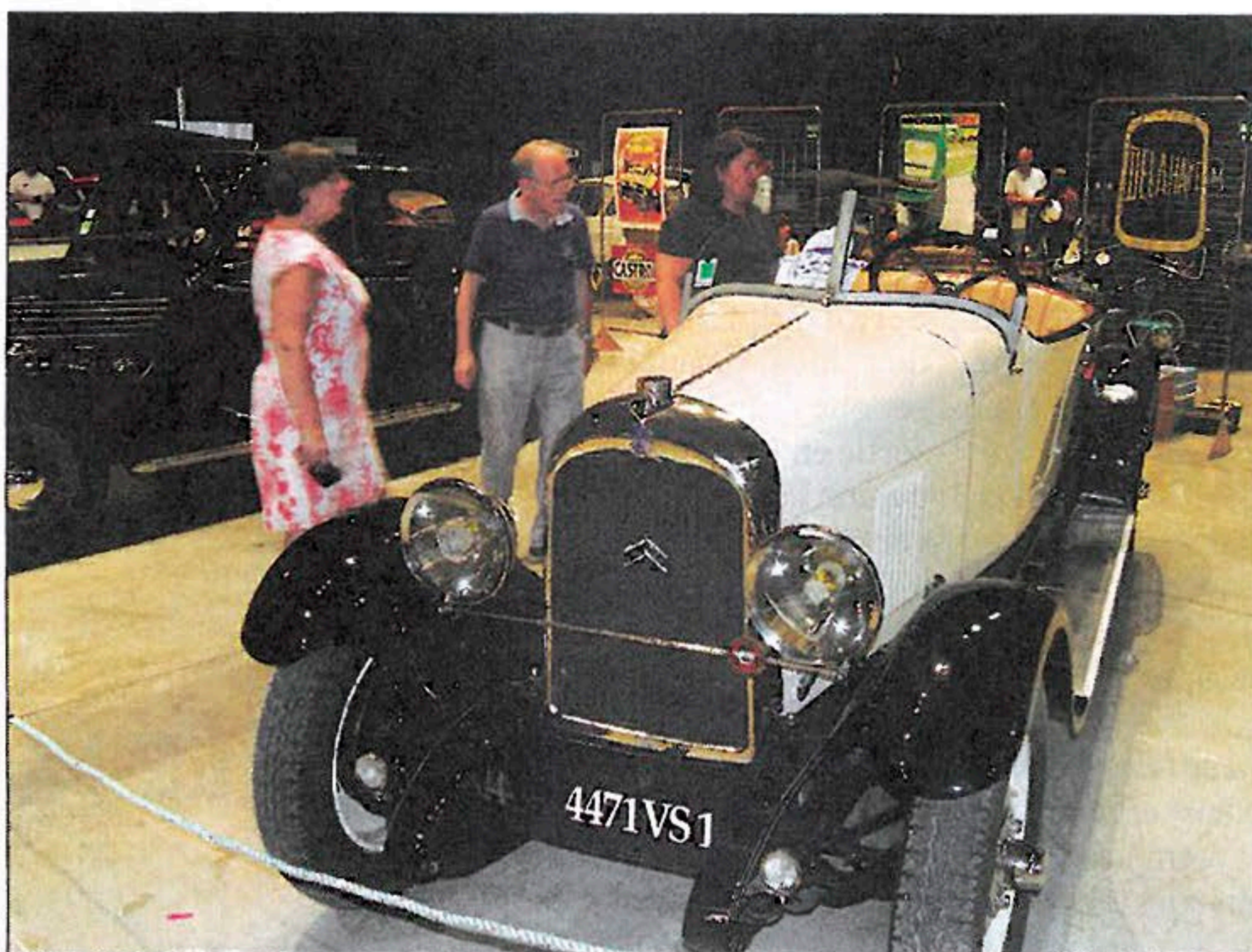
◀ Torpédo Citroën B 14 de 1927 version sport : c'est un Caddy !