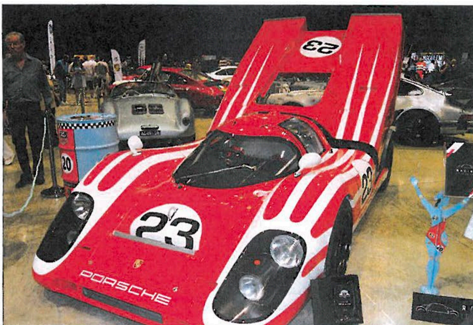
◀ Réplique de Porsche 917 6-cylindres refroidi par air, proprement construite par Bayley Cars, en Afrique du Sud : 185 000 € HT ! Derrière, une évocation de Porsche 550 RS en polyester.