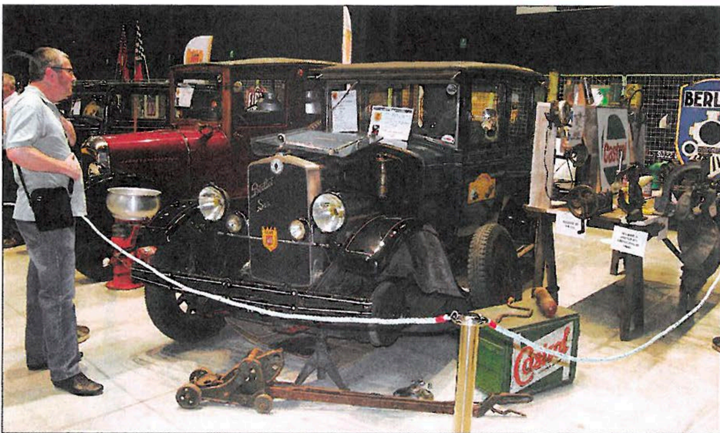
▲ Jolie évocation d'un atelier d'époque : Pierre Pequin, fondateur des Vieilles roues charentaises, a restauré cette Berliet 10 CV 6-cylindres de 1927 en 1968.