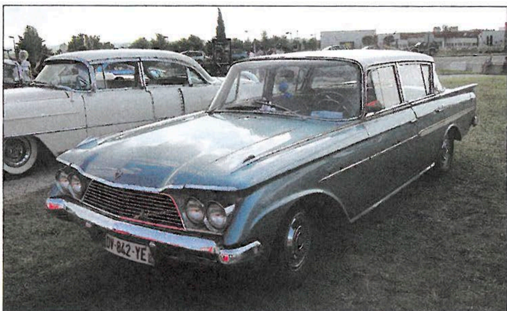
▲ De belles autos à découvrir à l'extérieur, dont cette Rambler Ambassador, unique en France, qui fut celle de l'avionneur Marcel Dassault.

de restauration. Sa transmission par chaînes en a intrigué plus d'un ! Cette 2 CV sortie de grange couverte de rouille sèche va peut-être inciter à sauver un modèle, qui sait ? Combien se sont-ils rendu compte que le torpédo Citroën Type A aura 100 ans l'année prochaine ? Il ne fait pas son âge. Dans le hall, plusieurs D.B Monomill rappellent l'épopée course de Panhard. L'outillage d'un garage d'autrefois, qui entoure la 10 CV Berliet 6-cylindres 1927, a dû paraître bien énigmatique à beaucoup, en particulier la presse à vulcaniser les chambres à air. Des contrastes aussi : le minuscule châssis motorisé de cabriolet Rosengart LR 2 et son pendant Austin Seven en version