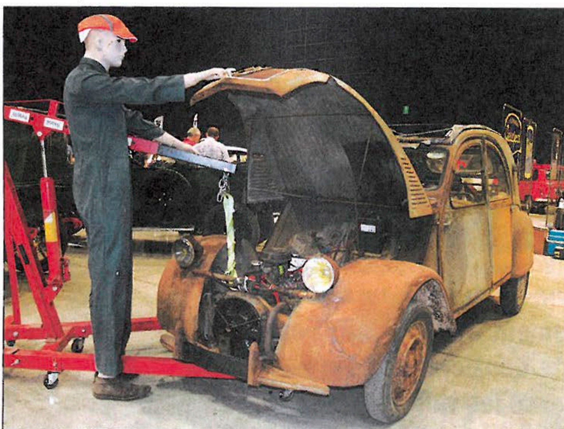
◀ Cette 2 CV 1953 est une vraie sortie de grange. Elle a fait sensation !