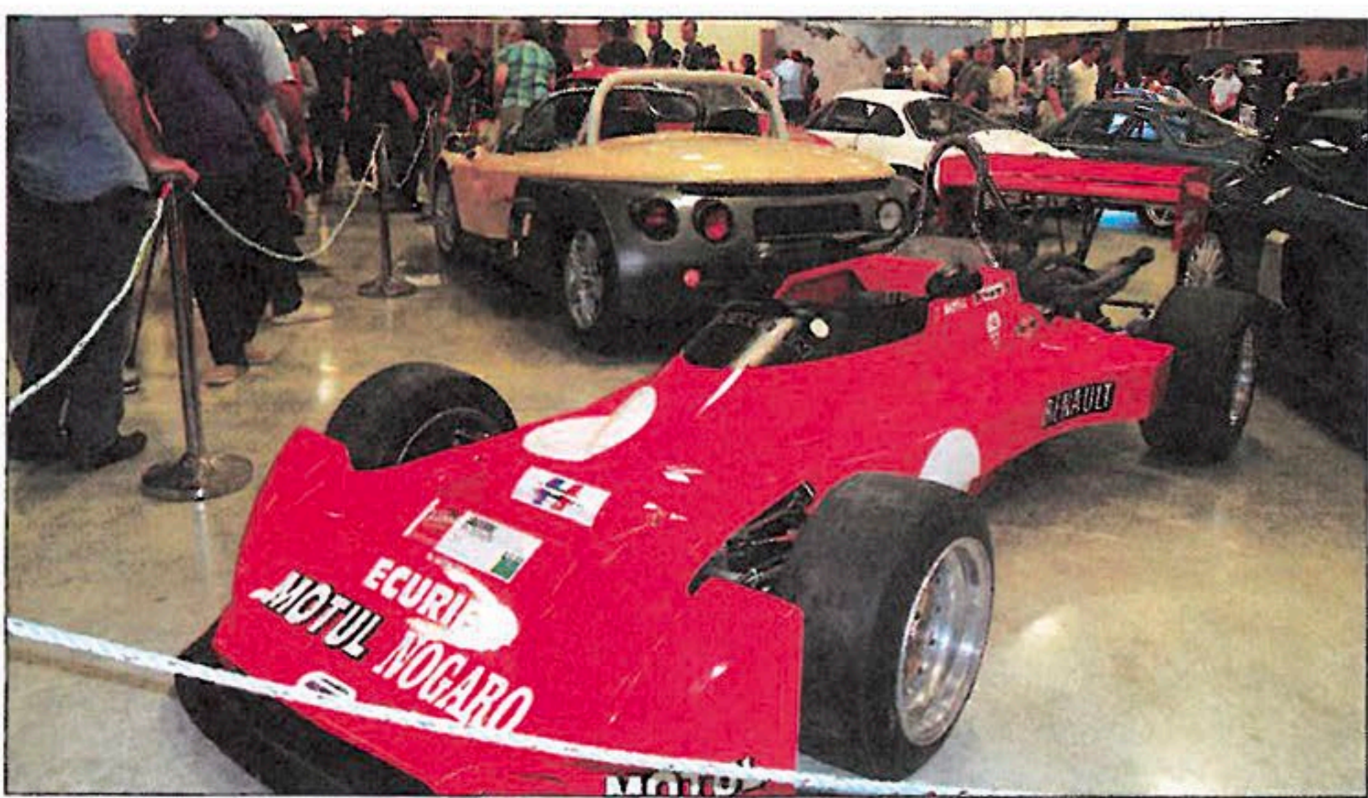
▲ Dans l'espace consacré à Renault Sport, cette Martini Mk 20 de 1977.

course, ou bien encore la Ford T 1915 – et sa suspension agrémentée de ressorts anti-dévers – bien frêle à côté de la Ford Tudor 1954 ! La gamme des populaires françaises des années 1950-1960 était bien représentée. Parmi les modèles que l'on voit le moins souvent, citons par exemple la camionnette tôleée Simca 6, la sportive Sovam 1966, la Voisin C14 de 1928, le cabriolet Delage D 4 de 1934 – premier prix Prestige du Salon - le cabriolet Daimler V8 SP 250, l'Alpine A 110 GT4, l'austère Austin Norfolk 6-cylindres 1938 ou encore la Citroën B 14 Caddy 1927 et la Rambler Ambassador, seul modèle importé en France par l'avionneur Marcel Dassault. ■