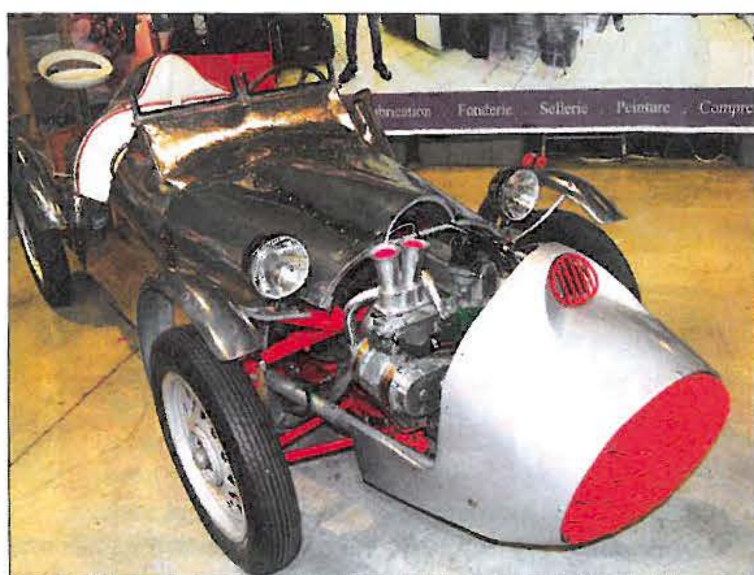
Simca 6 préparée par le Californien Stanley Heise en 1954. Maintenant dotée d'un compresseur Cozette, elle devrait atteindre les 100 km/h ! ▶